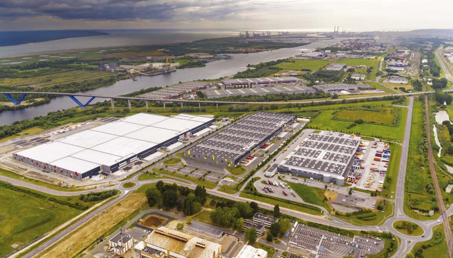
Le Parc Logistique du Pont de Normandie