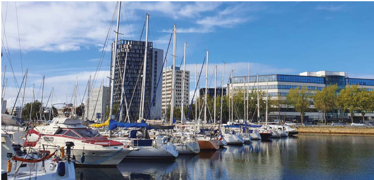
Le pôle d'affaires des gares au Havre

Véritable poumon économique en Normandie et à l'échelle nationale, notre territoire est au cœur des enjeux de transition vers une économie plus respectueuse du climat comme des ressources naturelles, à la fois ouverte sur les échanges internationaux et capable d'offrir des filières d'approvisionnement locales. Le Havre Seine Métropole et les acteurs du territoire relèvent conjointement les défis d'une économie durable.