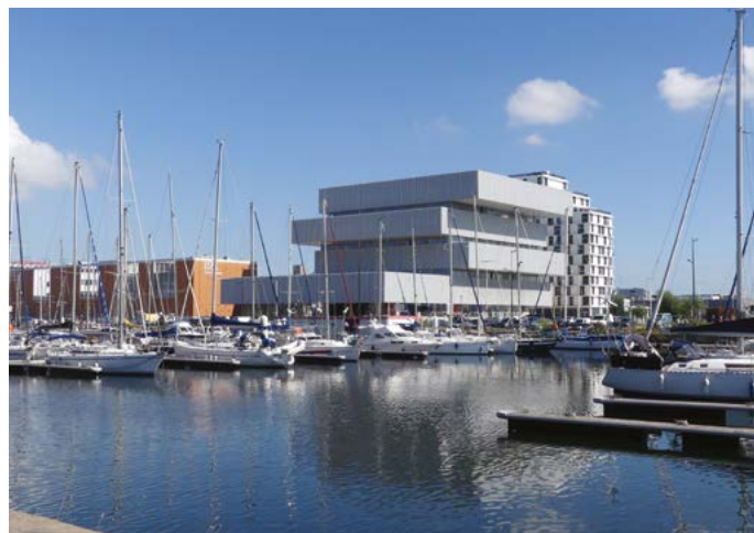
Le campus Le Havre-Normandie poursuit son développement

Pour réussir ces mutations et faire partie des territoires en pointe, la Communauté urbaine a lancé, en 2020, le projet Le Havre, ville portuaire intelligente associant de nombreux partenaires privés et publics. Grâce à la mobilisation d'importants financements (subventions et participations), une quarantaine de projets sont aujourd'hui labellisés pour leur potentiel d'innovation, leur cohérence avec les enjeux de transition, d'attractivité et de compétitivité, ou encore leur impact sur les compétences et l'emploi. Le Havre, ville portuaire intelligente stimule les investissements publics et privés qui transforment le territoire, dans des domaines aussi divers que l'énergie, l'environnement, la mobilité des biens et des personnes, l'attractivité du territoire pour les entreprises, la gestion de la donnée ou encore la qualité de vie des habitants.