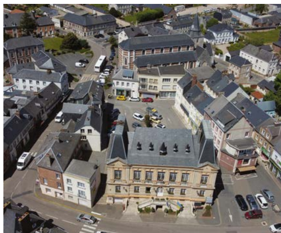
Le centre-bourg de Criquetot-l'Esneval

Sur le volet dynamique commerciale, les trois villes sont désormais dotées d'un droit de préemption commerciale qui leur permet de faciliter l'installation de commerces de proximité. À Étretat, une charte des enseignes, devantures et terrasses sera proposée au printemps, issue d'une concertation avec les commerçants. Elle permettra d'assurer la bonne intégration des activités commerciales dans le paysage urbain.