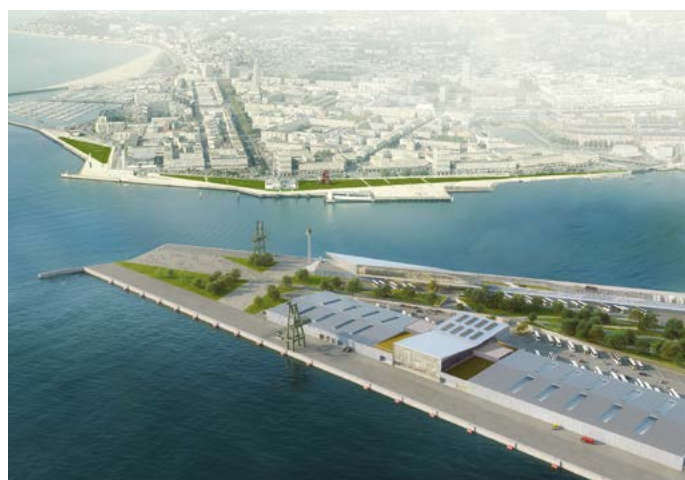
Le futur Terminal Croisière, pointe de Floride