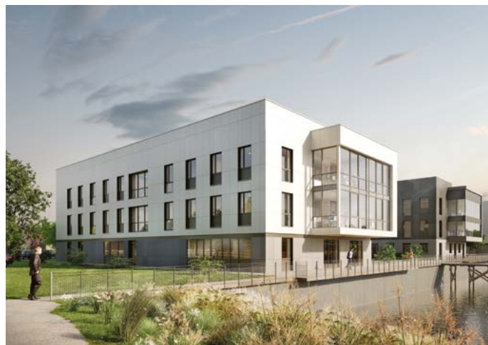
Le parc d'activités tertiaires Le Havre Plateau